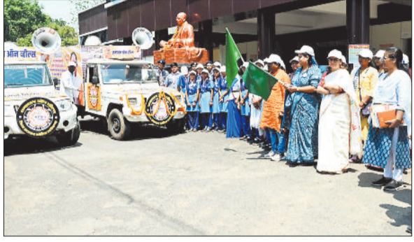
शुभारंभ करती जिला पंचायत अध्यक्ष, उपाध्यक्ष व अन्य।