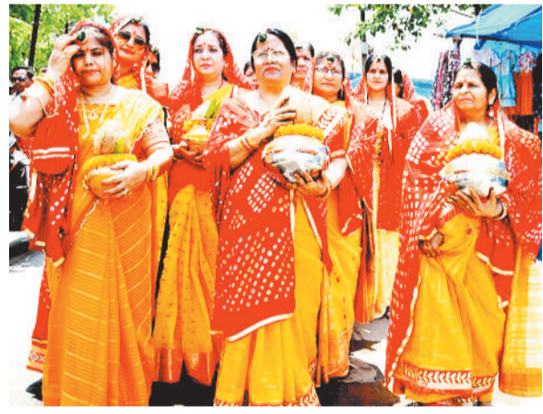
कलश यात्रा में शामिल श्रद्धालु। भजन, कीर्तन और प्रसाद वितरण की भी व्यवस्था की गई है। स्थानीय श्रद्धालुओं में आयोजन को लेकर विशेष उत्साह देखा जा रहा है।