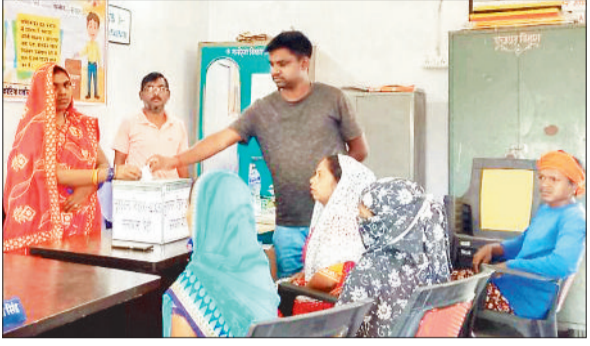
रखी गई समाधान पेटी।